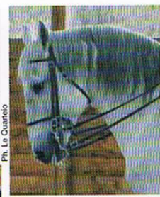
Ph. Le Quantec

surprises, il sera possible de se contenter d'indications, de touches rapides d'un éperon arrondi adouci à l'extrême (voire en plastique!) Il existe malheureusement des ca-